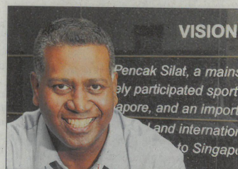
SHEIK ALAU'DDIN: Turut mengetuai Persekutuan Pencak Silat Asia (APSIF).

Mengambil kira sekurang-kurangnya 14 persekutuan silat Eropah dan Oceania yang